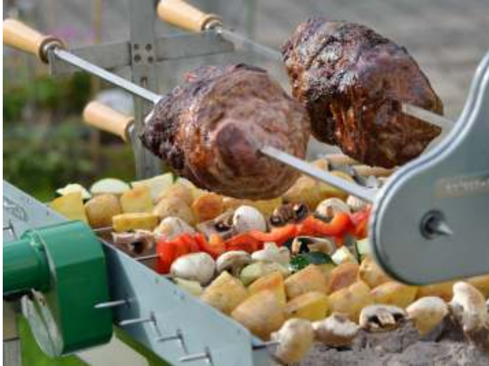
Spiessbraten und Gemüsespieße