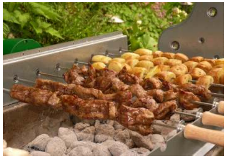
Rinder- und Kartoffelspieße