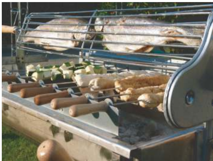
Frische Forellen und Beilagen