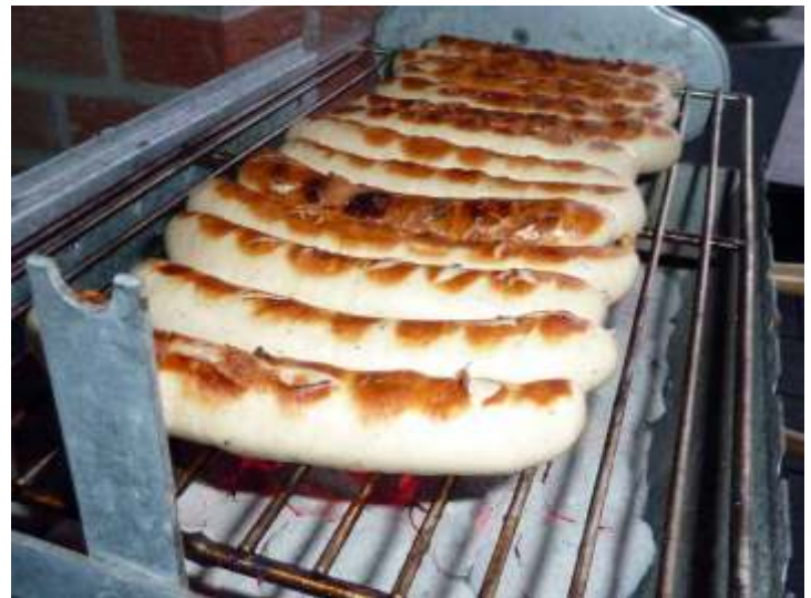
Rostbratwürstchen auf dem optionalen System-Grillrost aus VA-Edelstahl