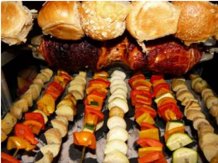
Spiessbraten und Gemüsespieße