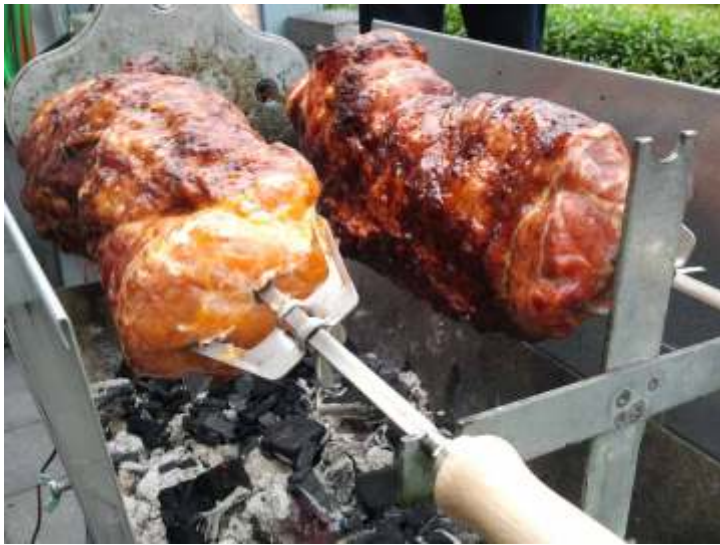
6,0 Kg Spiessbraten