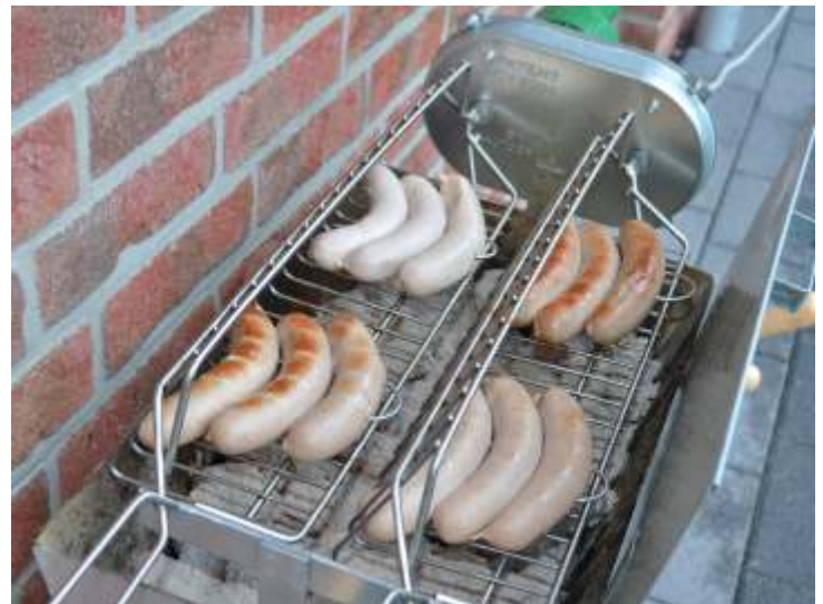
Rostbratwürstchen auf dem optionalen automatischen Schwenkgrill-Aufsatz mit Wendeautomatik

Universell - automatisch - unverwüstlich ein echter Spiessgriller!