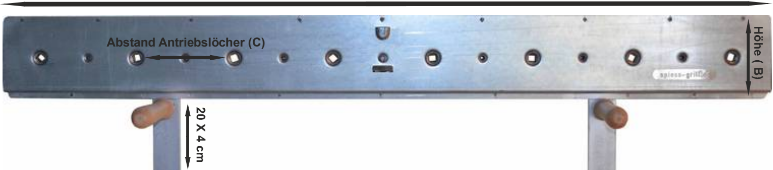
Gesamtbreite Antriebskassette (A)