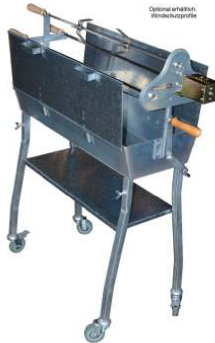
Optional erhältlich: Windschutzprofile

Windschutzprofile für konzentrierte Hitze auf dem oberen Antrieb des Holzkohlegrills. Zusammen mit dem Schutzdeckel können sie z.B. Schutz bei einsetzendem Regen bieten.