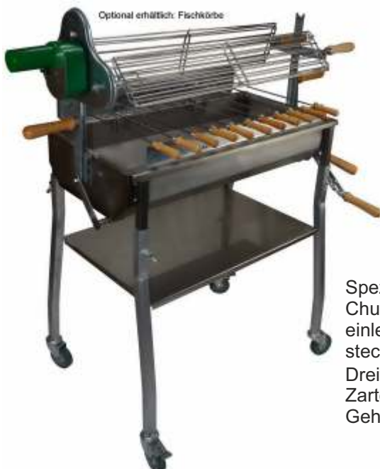
Optional erhältlich: Fischkörbe

Spezielle Grillkörbe erweitern den Spiessgrill Churrasco 70 zum perfekten Fischgriller. Einfach einlegen, zuklappen und in die Spießaufnahme stecken.