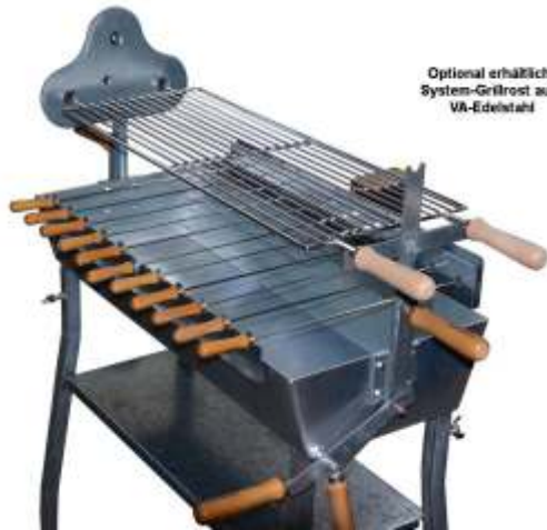
Optional erhältlich: System-Grillrost aus VA-Edelstahl

Der Systemgrillrost aus VA Edelstahl erweitert den Spiessgrill zum komfortablen und höhenverstellbaren Rostgriller. Die hohe Qualität des Edelstahls ermöglicht eine rasche und rückstandsfreie Reinigung.