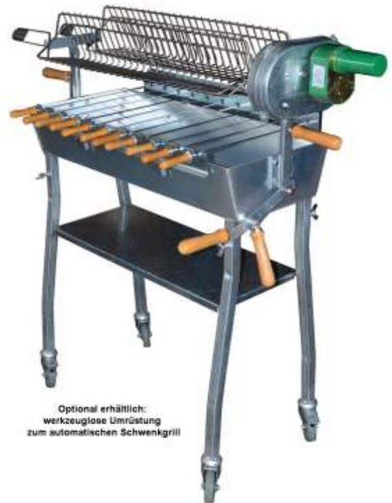
Optional erhältlich: werkzeuglose Umrüstung zum automatischen Schwenkgrill

Der automatische Schwenkgrillaufsatz: Perfekte Grillergebnisse durch motorgesteuerte Schwenk- und Wendintervalle