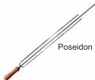
Poseidon Full Size