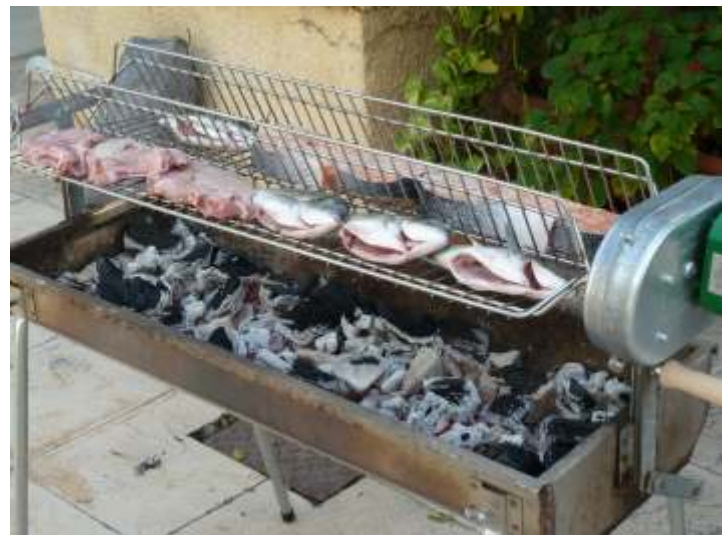
Doraden, Lachssteaks und Steaks auf dem optionalen automatischen Schwenkgrill-Aufsatz mit Wendeaomatik

Universell - automatisch - unverwüstlich ein echter Spiessgriller!