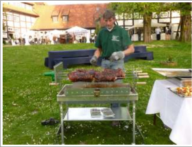
Hotel Catering Maritim Bad Sassendorf