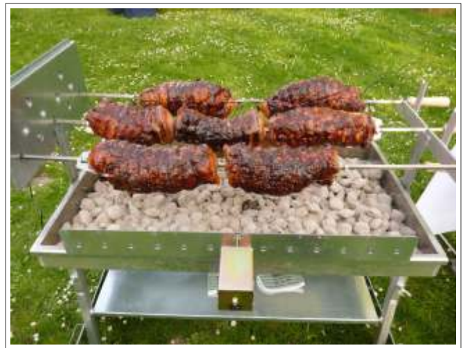
15 Kg Spießbraten