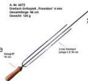
A.-Nr. 6075 Dreitach Grillspieß „Poseidon“ 4 mm Gesamtlänge: 66 cm Gewicht: 125 g