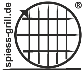
Spiessgrill Churrasco 90 Catering