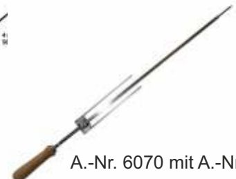
A.-Nr. 6070 mit A.-Nr. 6110